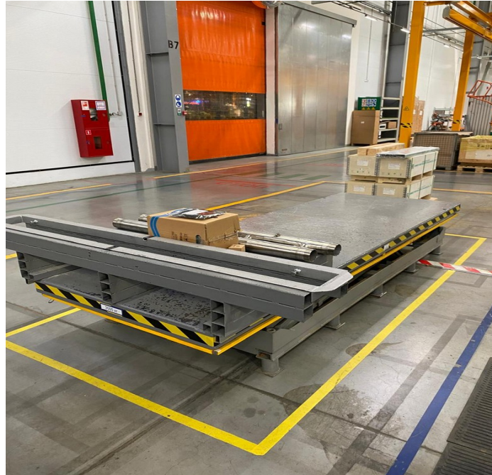
Место углубления и углубляемый стол